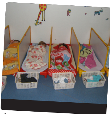
À la sieste... pour rêver ! (pour les petites et moyennes sections, à partir de 13h)