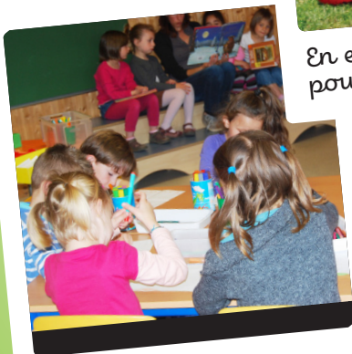
En intérieur... pour jouer calmement !