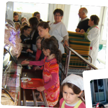
Tous à table !