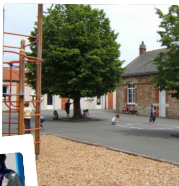
Côté cour élémentaire !