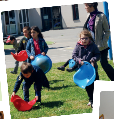
En extérieur... pour se dépenser !