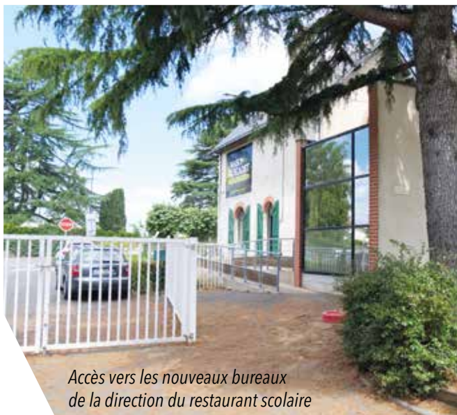
Accès vers les nouveaux bureaux de la direction du restaurant scolaire