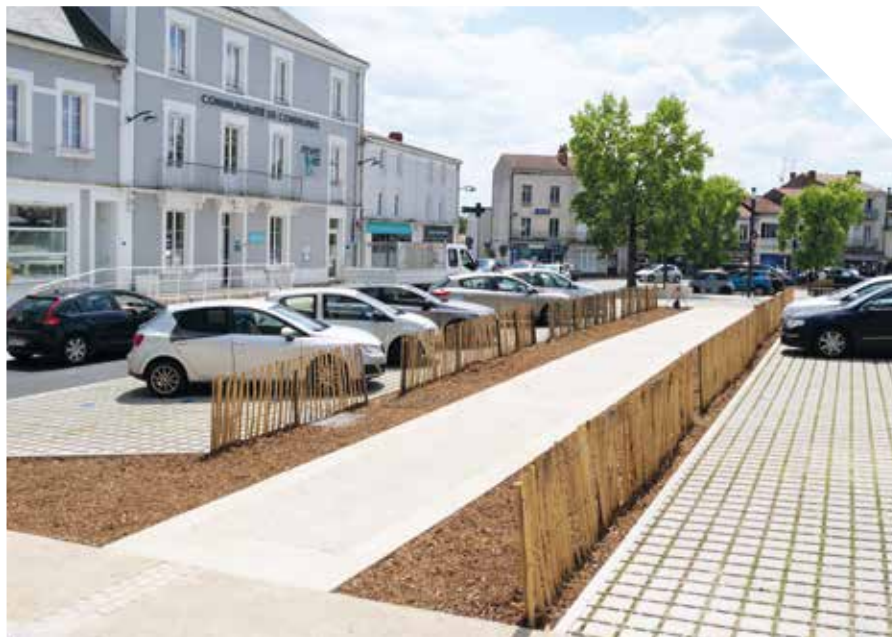
Les bandes de copeaux, place Dulanloy, attendent leurs plantations.

peu d'arrosage. Les jeunes pousses seront suivies sur les deux premières années après la plantation, en fonction des conditions climatiques, mais se développeront ensuite de leur propre chef.