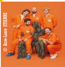
CONCERT ASSIS / DEBOUT

Sans compter tous les autres spectacles inclassables mais immanquables : Bien, reprenons ! (entre le théâtre, la musique et l'humour), Héroïnes à la croisée du théâtre documentaire et du théâtre d'objets, la plainte criminelle des Disparues de