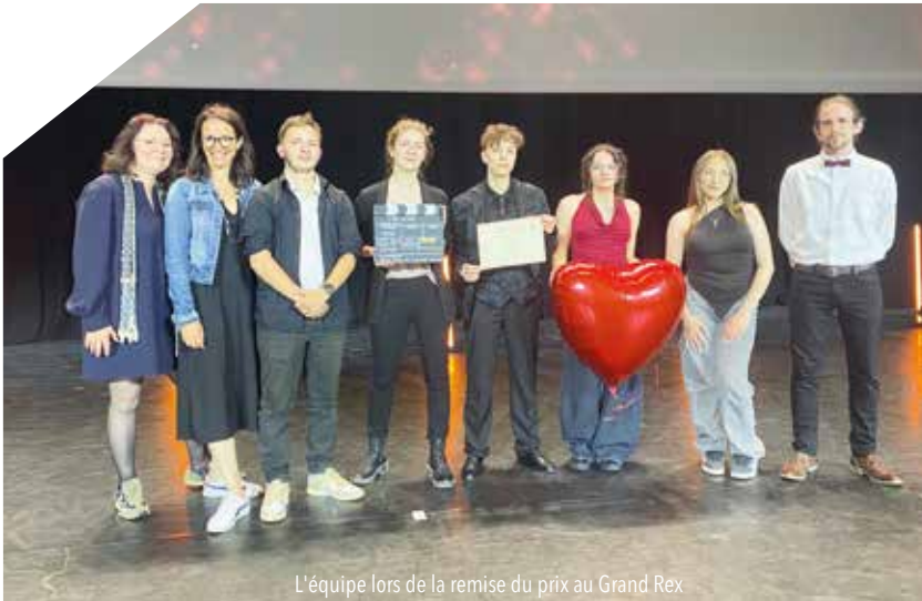
L'équipe lors de la remise du prix au Grand Rex