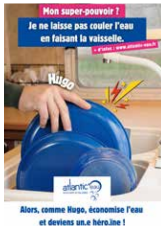
Alors, comme Hugo, économise l'eau et deviens un.e héros.e !

Soyons tous vigilants ! Pour préserver nos ressources en eau, adoptons des gestes simples au quotidien. En cuisine, coupez l'eau pendant que vous savonnez vos mains et lavez vos légumes dans une bassine pour réutiliser l'eau à l'arrosage. Privilégiez des appareils électroménagers récents en mode « éco » et équipez vos robinets de mitigeurs thermostatiques pour limiter la consommation. Dans la salle de bain, préférez la douche au bain, installez des pommes de douche économes et évitez de laisser l'eau couler inutilement. Optez pour une chasse d'eau à double commande dans les toilettes. Au jardin, récupérez l'eau de pluie, arrosez tôt ou tard et utilisez un arrosage goutte à goutte. Ces gestes simples contribuent à une gestion responsable de l'eau dans notre commune.