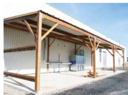
Un préau réalisé par les agents.

Le réaménagement de tous les espaces a été conçu avec l'aide d'un maître d'œuvre. Ainsi, la plupart des travaux ont été confiés à des entreprises mais certains ont été réalisés en régie par les équipes.