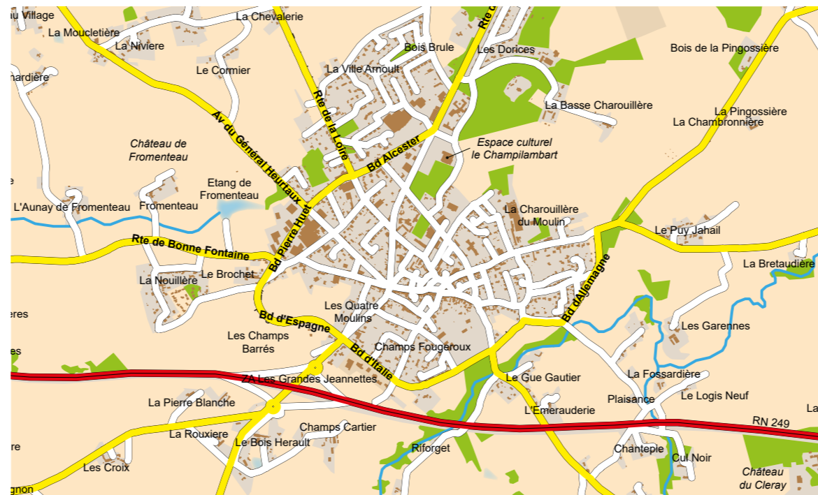
Plan des voies départementales (en jaune et rouge) et communales (en blanc).