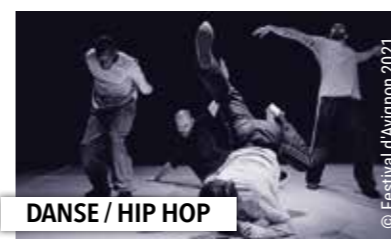
DANSE / HIP HOP