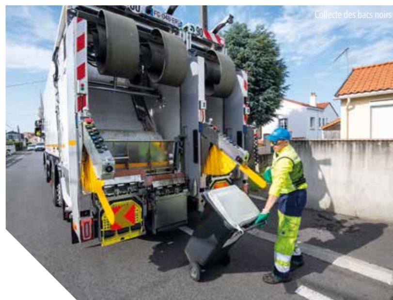
Collecte des bacs noirs