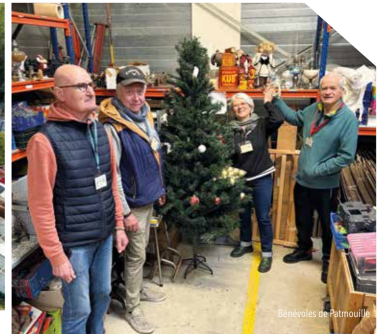
Bénévoles de Patmouille

métalliques, comme les boîtes de conserve ou les canettes, sont fondus puis réutilisés pour produire de nouveaux objets en acier ou en aluminium. Quant aux briques alimentaires (type briques de lait ou de jus), elles sont séparées en leurs différentes matières pour être transformées en papier, en carton ou en nouveaux emballages. En 2024, 1 775 tonnes d'emballages ont été collectées.