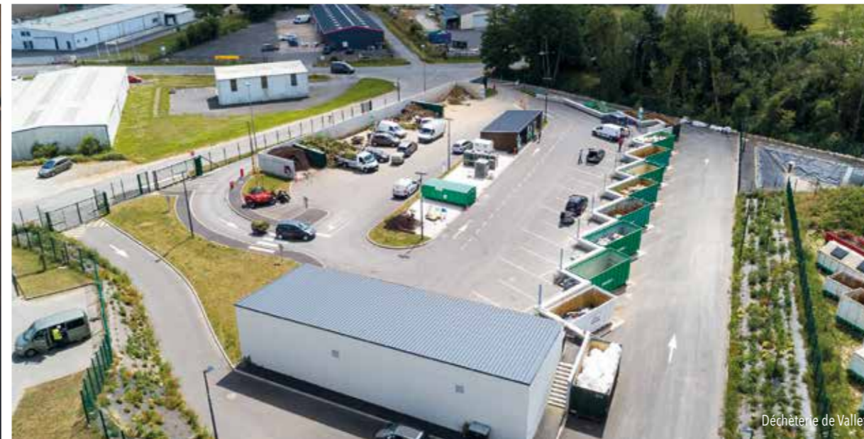
Déchèterie de Vallet