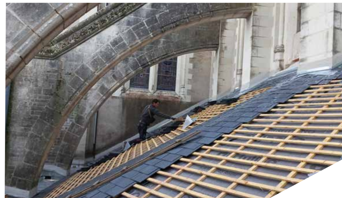
Réfection du toit de l'église