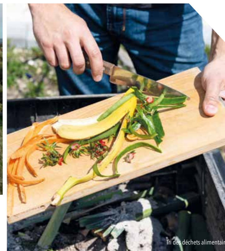
Tri des déchets alimentaires