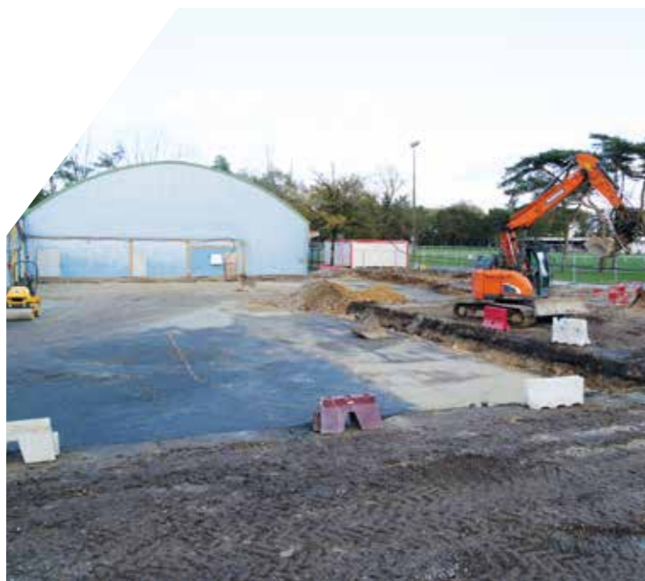
Le complexe des Dorices