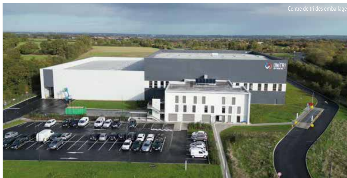
Centre de tri des emballages