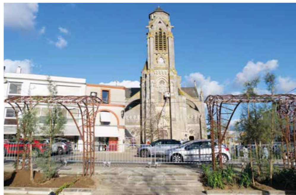
Aménagement de la place Charles de Gaulle