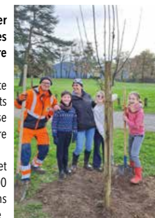
Les enfants du conseil municipal des enfants participent à la plantation des arbres.

En parallèle, les espaces verts continuent leur projet de plantations d'arbres, cette année plus de 100 arbres seront plantés dans le parc des Dorices, dans la zone de pique-nique, près de la salle du clos de la Cour et derrière le terrain de BMX.