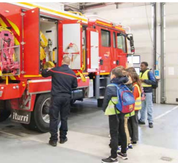
Lors du rallye citoyen, les élèves ont pu visiter le centre de secours