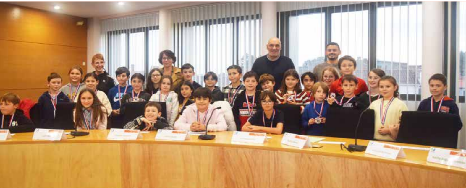
Les élus du nouveau conseil municipal des enfants lors de leur intronisation