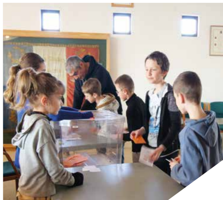
Les élèves expérimentent le vote dans le cadre du classeur du jeune citoyen