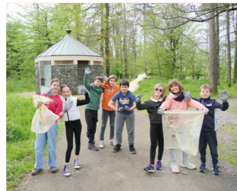
Course aux déchets organisée par le conseil municipal des enfants en avril 2024