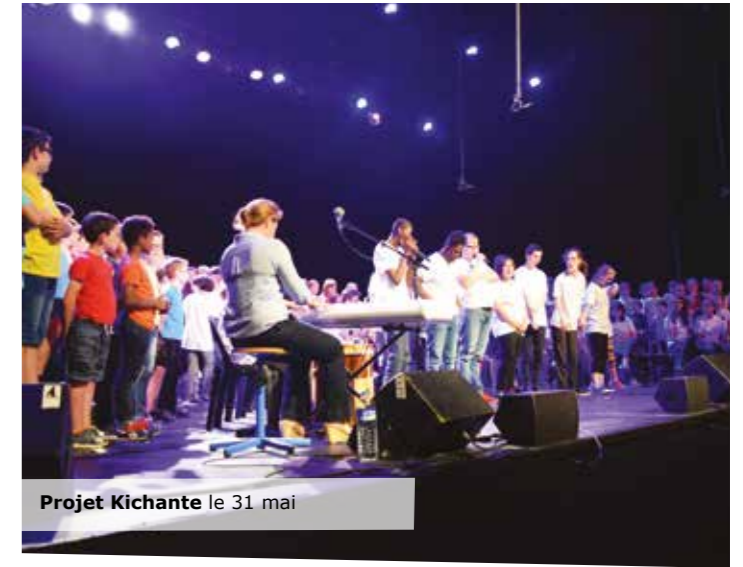
Projet Kichante le 31 mai