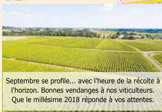
Septembre se profile... avec l'heure de la récolte à l'horizon. Bonnes vendanges à nos viticulteurs. Que le millésime 2018 réponde à vos attentes.

Château de la Ferté la Ferté 02 40 86 37 48