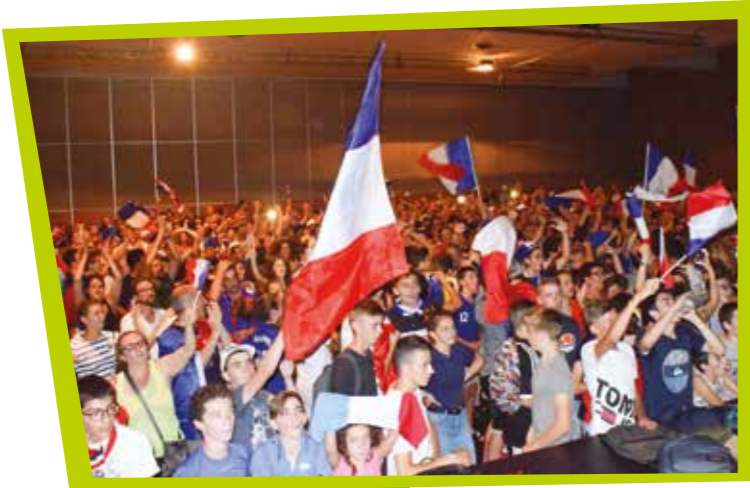
Retransmission de la Coupe du monde de football au Champilambart

La période estivale s'étire encore avec bonheur, tous enivrés que nous sommes du parcours sans faute de notre équipe nationale de football, devenue Championne du Monde. Ce mouvement de liesse populaire et de fierté nationale restera imprégné dans les cœurs de tous les Français(e)s.