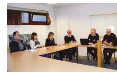
Réunion comité de pilotage février 2018

Cette démarche de concertation a été poursuivie le 5 juillet, auprès des agences immobilières et propriétaires de baux commerciaux, appelés eux aussi à être acteurs du renforcement de la vitalité du centre - ville.