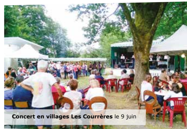
Concert en villages Les Courrères le 9 juin