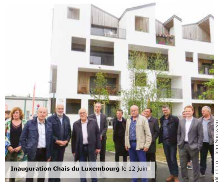
Inauguration Chais du Luxembourg le 12 juin