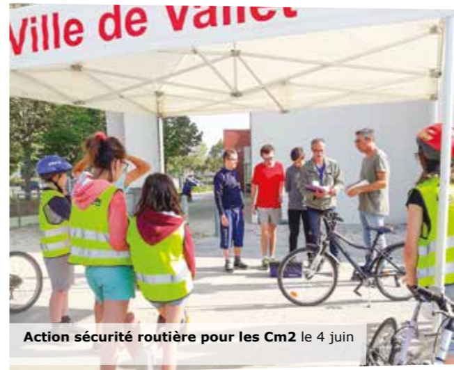
Action sécurité routière pour les Cm2 le 4 juin