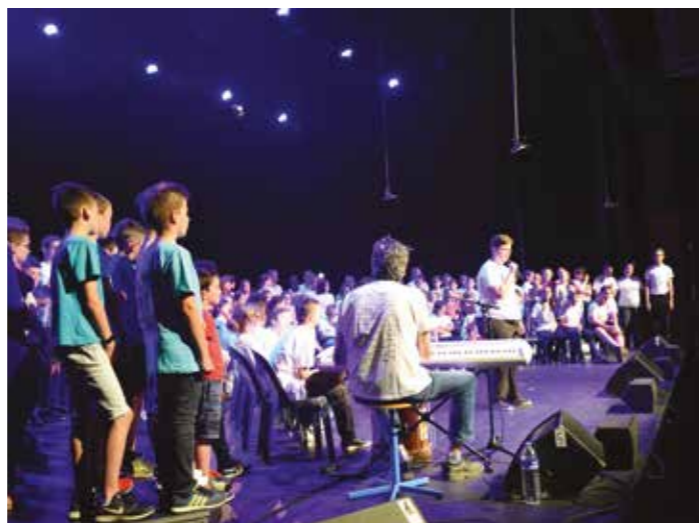
Spectacle projet "Kichante" le 31 mai

Au-delà de l'intérêt d'une telle action pour le bien vivre ensemble, le respect des différences, le partage d'une pratique musicale ; c'est bel et bien le plaisir de donner collectivement un beau spectacle final qui a rassemblé tout le monde. Preuve en est : sur scène, sourires et émotions étaient au rendez-vous devant plus de 200 spectateurs au Champilambart.