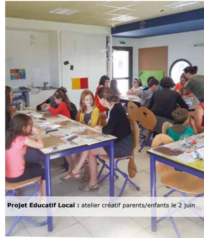
Projet Educatif Local : atelier créatif parents/enfants le 2 juin