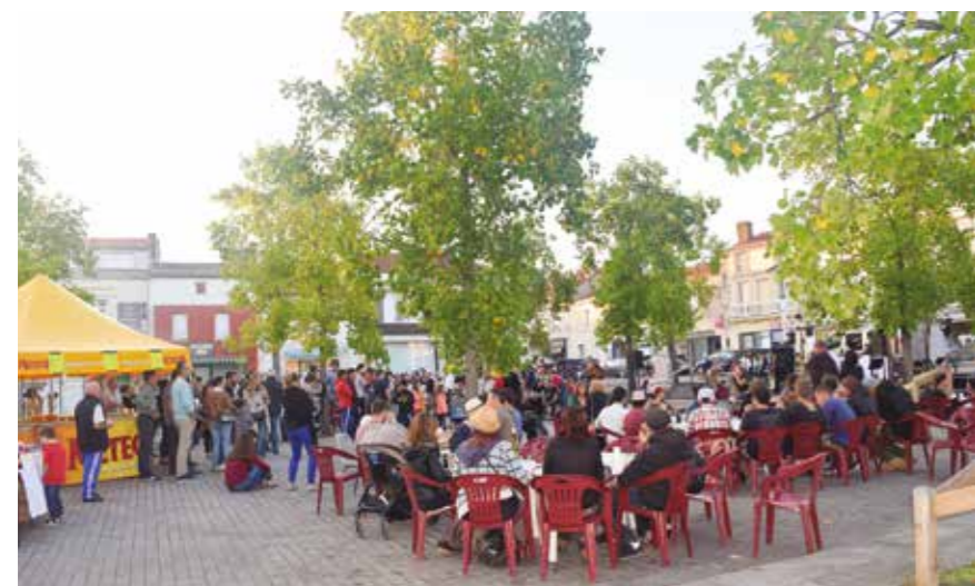
Animation "Le bourg se bouge" 01/09/2017

Premier enseignement : le secteur du commerce de proximité subit depuis une dizaine d'années de réelles transformations notamment liées aux nouveaux modes de consommations et au e.commerce (42 % des Français commandent au moins un achat par mois par internet). Les habitudes d'achat et de comportements changent. Mais l'expérience client reste recherchée lors des moments shopping (achat plaisir, de flânerie, achat responsable, achat innovant et de communauté, achat qui rend acteur...). A Vallet, le client recherche les conseils avisés des professionnels et la qualité des produits proposés est même plébiscitée, notamment dans le domaine alimentaire. Ce qui reste le 1 er motif de venue et d'achat en centre-ville, avant les rendez-vous médicaux, administratifs, les trajets pour l'école ....ou toute autre activité culturelle et de loisirs.