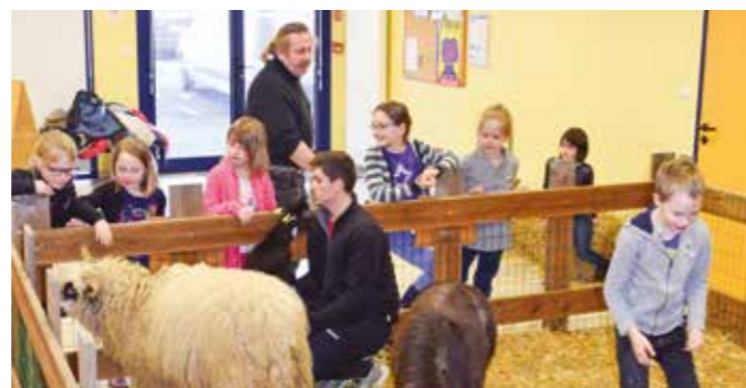
Atelier de découverte avec " Ma petite Ferme près de Chez Vous "

Le souhait est aussi d'étendre nos actions aux temps extrascolaires dans le cadre notamment du " plan mercredi ", en cours de définition par le Ministère de l'Éducation, pour pouvoir bénéficier du cadre réglementaire en lien avec le PEDT (financement et taux d'encadrement).