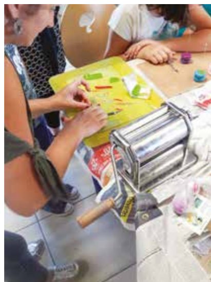
Atelier créatif le 2 juin