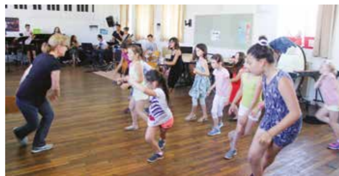
Répétition flashmob pour la fête de la musique 2018