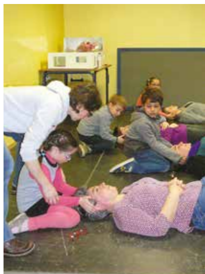
Atelier prévention le 24 mars