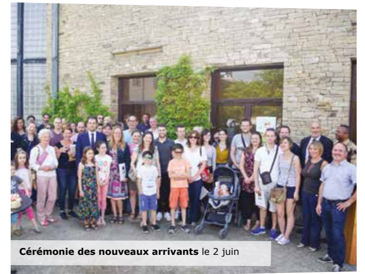
Cérémonie des nouveaux arrivants le 2 juin