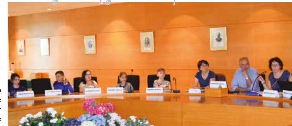
Les jeunes élus en séance plénière le 20 avril dernier

Les 28 enfants du CME, réunis en séance plénière le 20 avril dernier, ont présenté les différents projets qu'ils souhaitent voir se réaliser durant leur mandat. Le projet de skate-park est officiellement lancé.