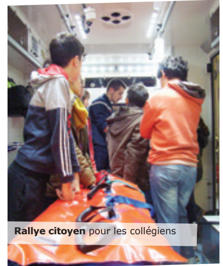
Rallye citoyen pour les collégiens