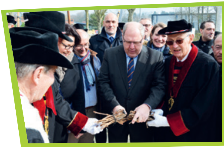
Inauguration Expo Vall' 2016