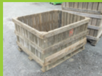
Palox pour les minis jardins

La municipalité va installer courant mai des palox ambulants sur une quinzaine de lieux (centre ville et villages). Ces mini-jardins seront à la disposition des habitants pour jardiner ensemble.