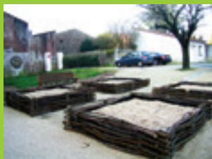
Jardin des plantes à pots

Dans la continuité de la création déjà en place du « jardin des simples ou herbarius » et du jardin bouquetier, le service espace verts a réinvesti la partie arrière de l'église, jusqu'alors inexploitée, en y créant un jardin potager dit « jardin hortus ».