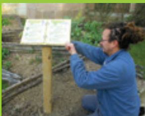
Panneau jardin des simples

Cette nouvelle déclinaison vient donc compléter le « jardin des simples », composé d'herbes aromatiques et médicinales, et le « jardin bouquetier », dont les couleurs bleu, rouge et jaune étaient cultivées pour leur beauté, leur symbole ainsi que leur valeur liturgique. Des panneaux explicatifs sont déjà en place pour ces deux derniers jardins, le nouveau jardin en sera prochainement équipé.