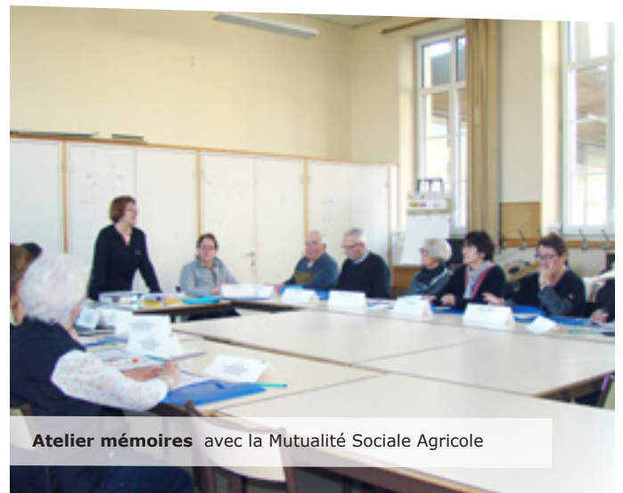
Atelier mémoires avec la Mutualité Sociale Agricole