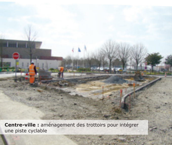
Centre-ville : aménagement des trottoirs pour intégrer une piste cyclable