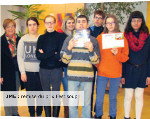
IME : remise du prix Festisoup