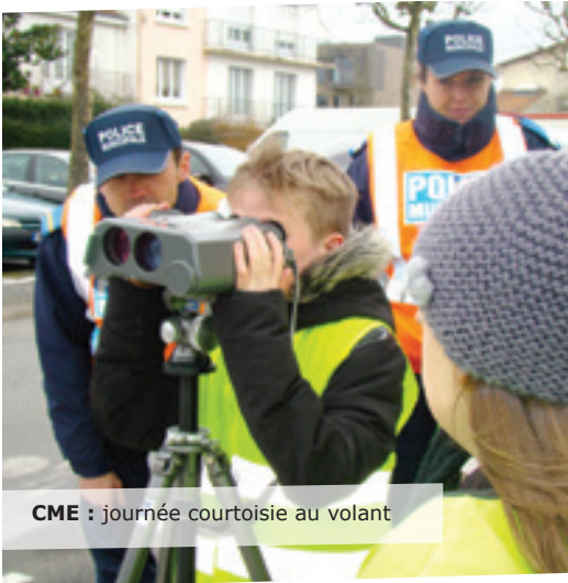
CME : journée courtoisie au volant