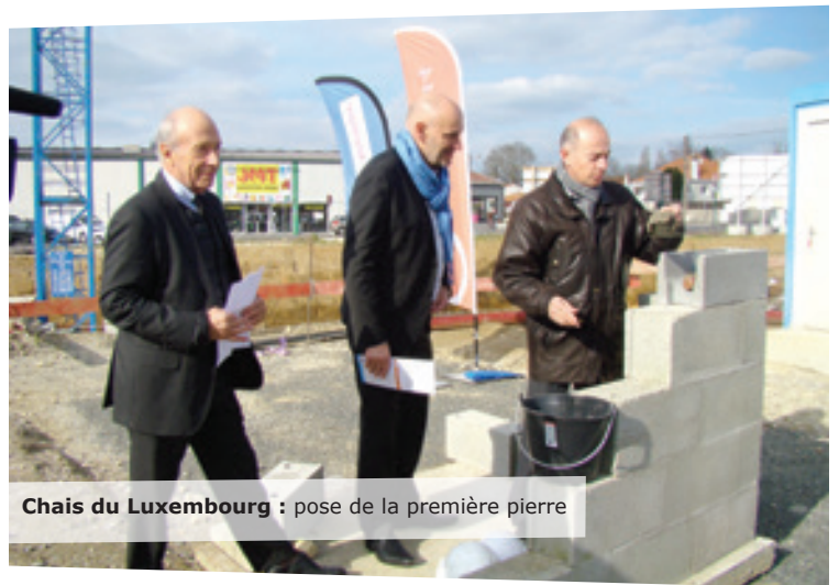
Chais du Luxembourg : pose de la première pierre