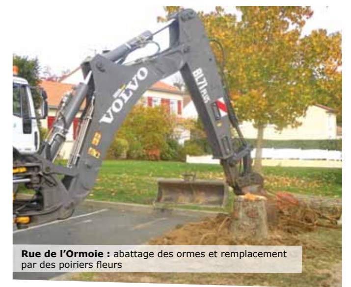
Rue de l'Ormoie : abattage des ormes et remplacement par des papiers fleurs