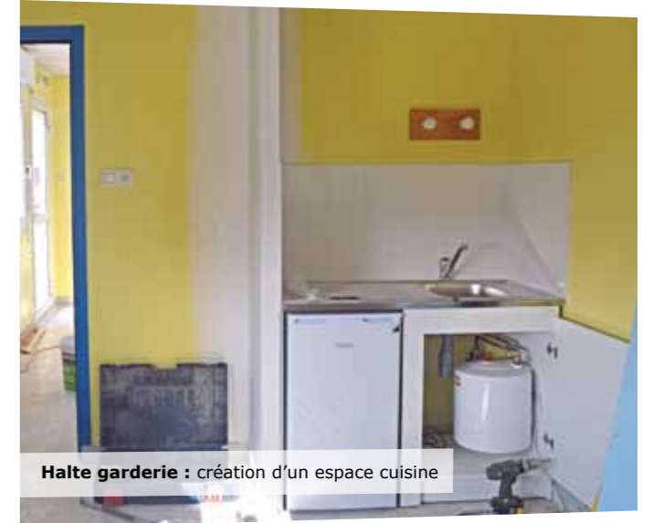
Halte garderie : création d'un espace cuisine