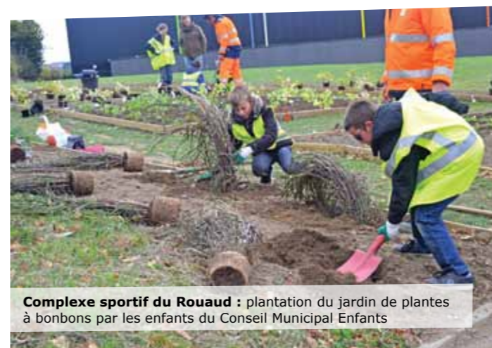
Complexe sportif du Rouaud : plantation du jardin de plantes à bonbons par les enfants du Conseil Municipal Enfants