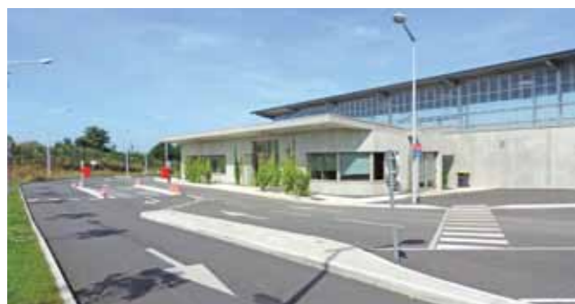
Le Complexe d'Accueil des Déchets - Le Loroux Bottereau

Renseignements : Service Gestion des déchets / 02 51 71 75 71 / gestion-déchets@cc-sevreloire.fr