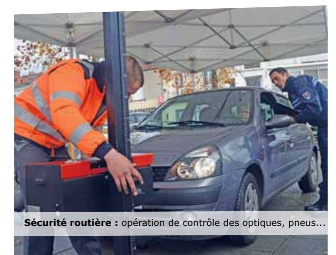
Sécurité routière : opération de contrôle des optiques, pneus...