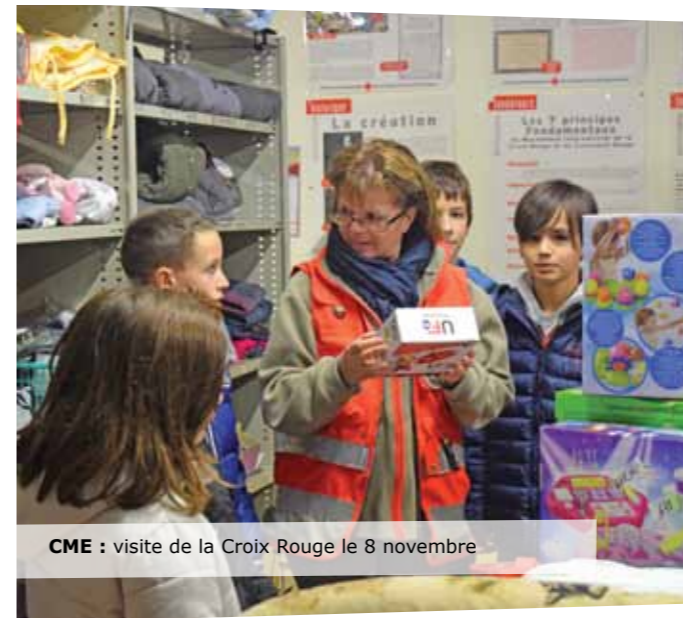
CME : visite de la Croix Rouge le 8 novembre