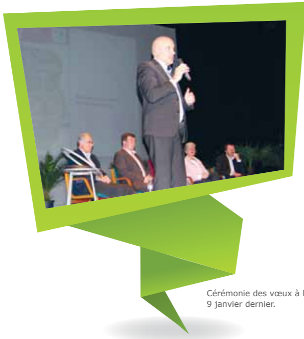
Cérémonie des vœux à la population le 9 janvier dernier.

N ous sommes forts de notre jeunesse à Vallet. Les 0-25 ans représentent, à eux seuls, près de 30% de la population. 17 % pour la tranche des 11-25 ans. C'est une des forces vives de notre territoire car nos jeunes sont les habitants et citoyens de demain.