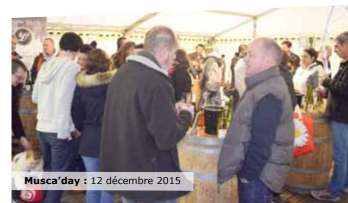
Musca'day : 12 décembre 2015