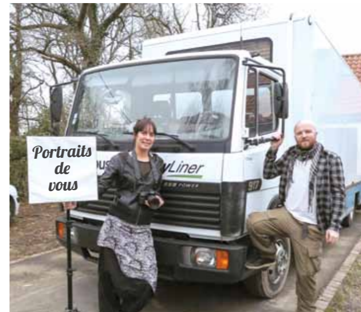
Portraits, interviews, échanges, le studio Vagabond vient à votre rencontre.