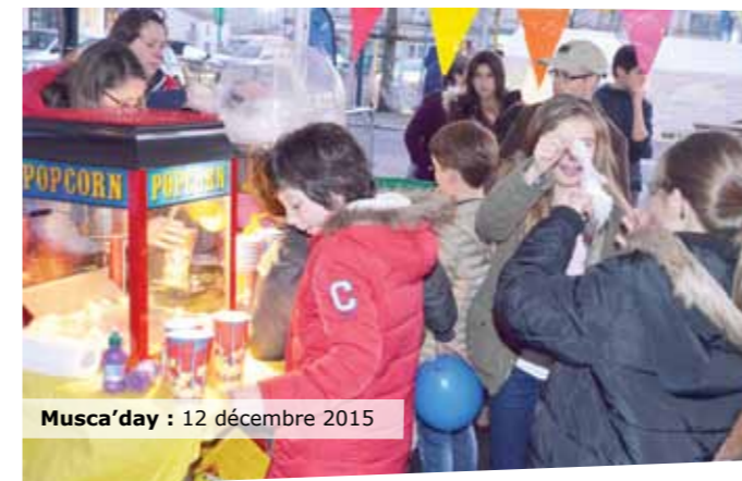
Musca'day : 12 décembre 2015