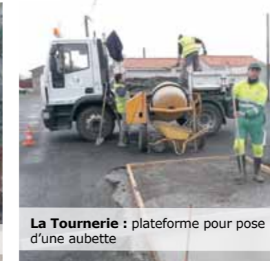
La Tournerie : plateforme pour pose d'une aubette