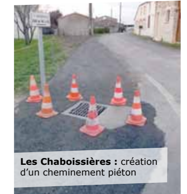
Les Chaboissières : création d'un cheminement piéton