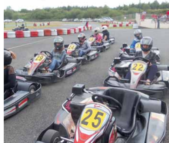
Animations Espace Jeunes Vallet (photo d'archives)

Cette enquête démarrée en 2015, se poursuivra ce premier semestre. L'objectif ? Collecter au plus près, la parole des principaux intéressés, « nos jeunes » ; sur leurs attentes, leurs besoins, leurs propositions mais aussi celle des parents, grands-parents, acteurs éducatifs et institutionnels qui vivent auprès d'eux. Cette manne d'informations permettra de dresser un portrait de la jeunesse valletaise d'aujourd'hui. De ces constats émergeront ensuite des projets et des actions spécifiques qui permettront de repenser et réajuster les modalités d'accueil et les axes de travail de la politique jeunesse. Différents temps forts sont ainsi programmés à partir de février jusqu'à la restitution finale de juin.