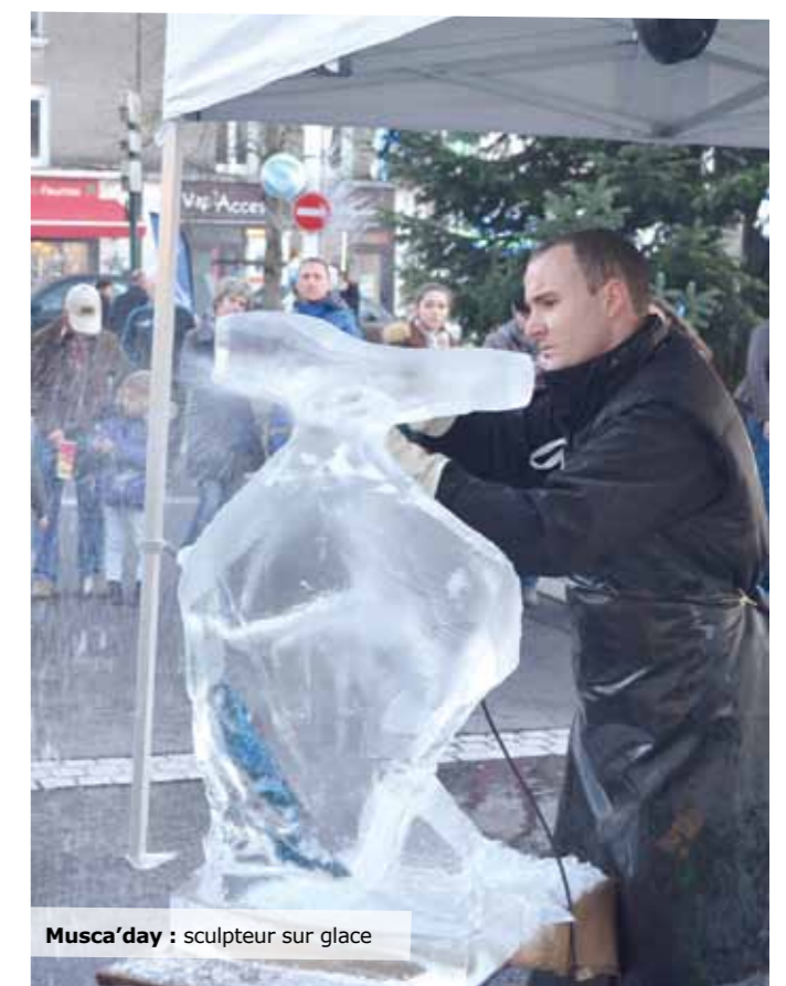
Musca'day : sculpteur sur glace