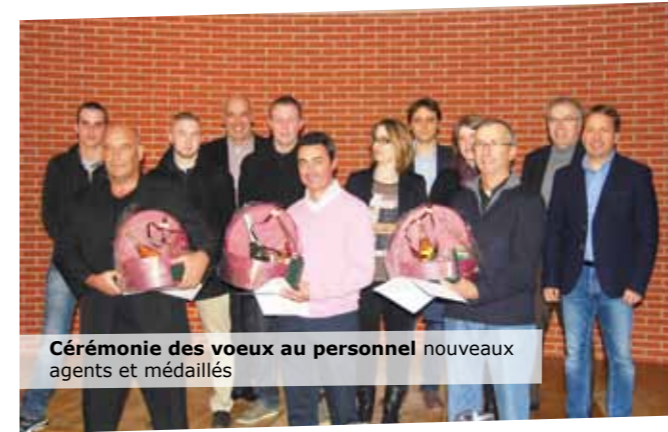
Cérémonie des vœux au personnel nouveaux agents et médaillés