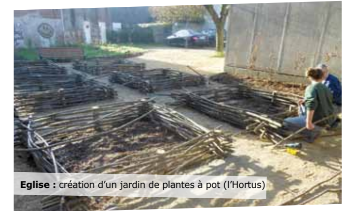
Eglise : création d'un jardin de plantes à pot (l'Hortus)