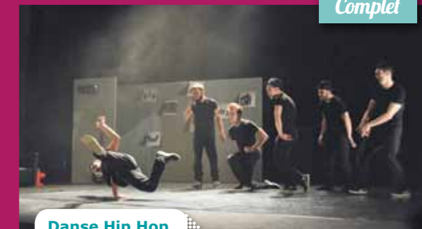
Danse Hip Hop

Mardi 23 février à 20h30 Rock it Daddy par la Cie S'Poart