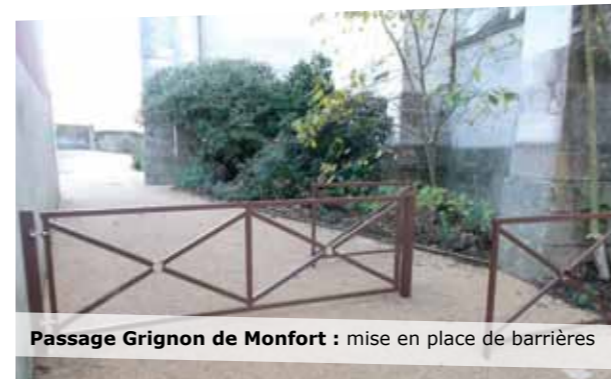
Passage Grignon de Monfort : mise en place de barrières