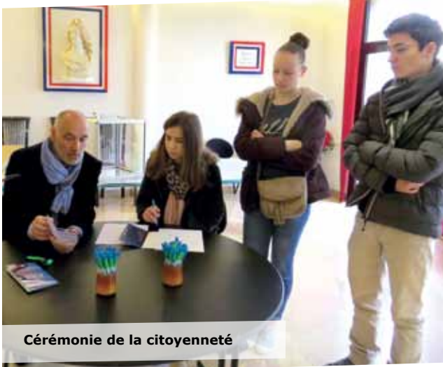
Cérémonie de la citoyenneté