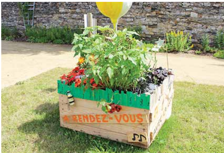
Palox minis-jardins à Angers

La ville de Vallet se lance dans un concept innovant à l'occasion du fleurissement estival. A partir du 1 er juin, la ville se dotera de 12 « mini-jardins partagés » qui vont éclore dans toute la ville. Une trentaine de palox seront ainsi installés ! Ceux qui le souhaitent sont invités à faire vivre ces lieux de culture. L'occasion de se rencontrer autour du jardinage entre voisins...!