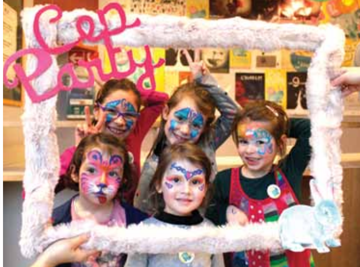
Cep party 2016

Un concept innovant avec Le festival jeune public Cep Party qui s'exporte dans les communes du Vignoble