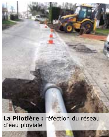
La Pilotière : réfection du réseau d'eau pluviale