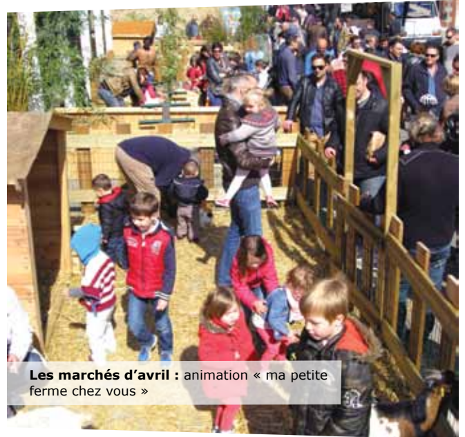
Les marchés d'avril : animation « ma petite ferme chez vous »