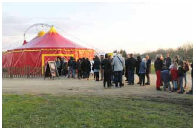
Cirque Aïtal avril 2016