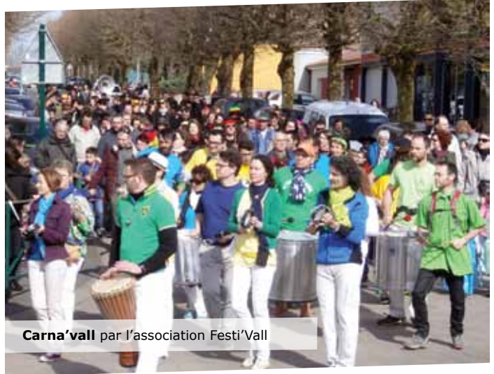
Carna'vall par l'association Festi'Vall