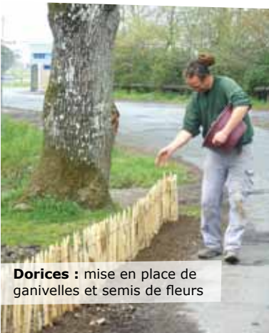
Dorices : mise en place de ganivelles et semis de fleurs