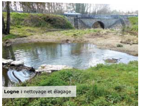
Logne : nettoyage et élagage