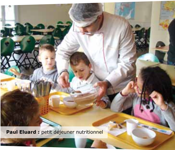
Paul Eluard : petit déjeuner nutritionnel