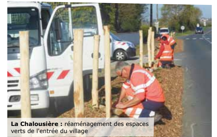
La Chalosière : réaménagement des espaces verts de l'entrée du village