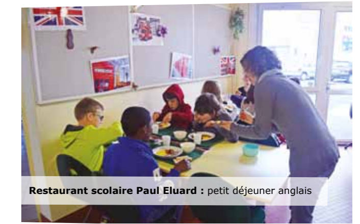
Restaurant scolaire Paul Eluard : petit déjeuner anglais