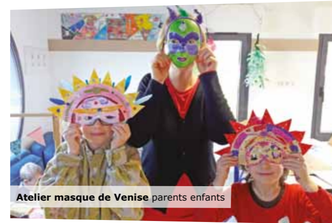
Atelier masque de Venise parents enfants

La volonté affichée et effective de l'équipe municipale est de soutenir, renforcer et dynamiser le commerce de proximité autour principalement de la place Charles de Gaulle. Il n'est pas question d'installer de commerces dans le futur quartier Saint Christophe comme l'a pourtant récemment rappelé un élu de l'équipe d'opposition à l'occasion de la réunion de concertation devant les commerçants et acteurs économiques. La Place Charles de Gaulle reste et restera le cœur de notre Ville.