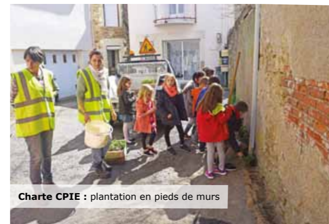
Charte CPIE : plantation en pieds de murs