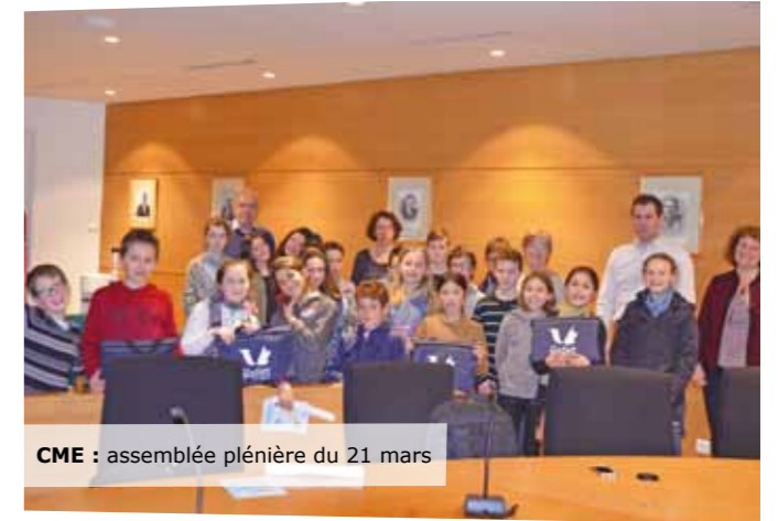
CME : assemblée plénière du 21 mars