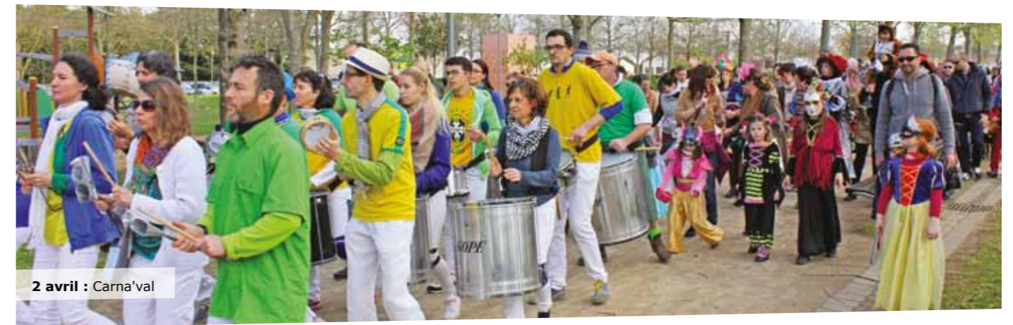
2 avril : Carna'val