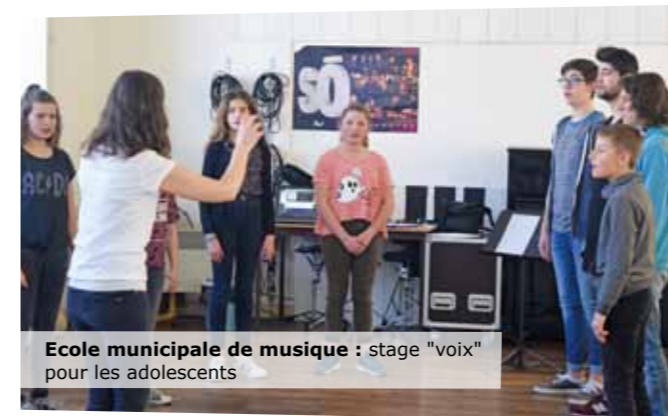
Ecole municipale de musique : stage "voix" pour les adolescents