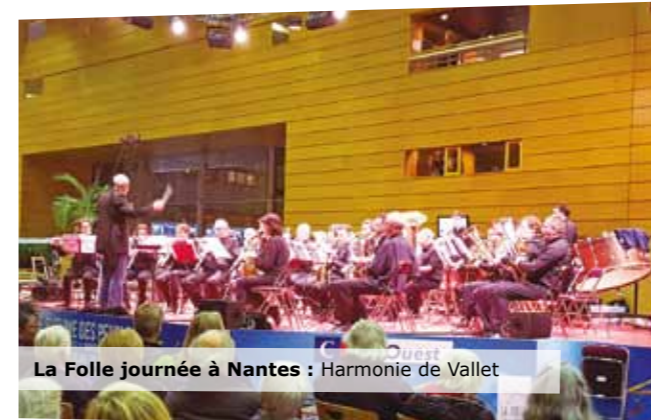
La Folle journée à Nantes : Harmonie de Vallet