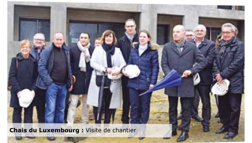
Chais du Luxembourg : Visite de chantier