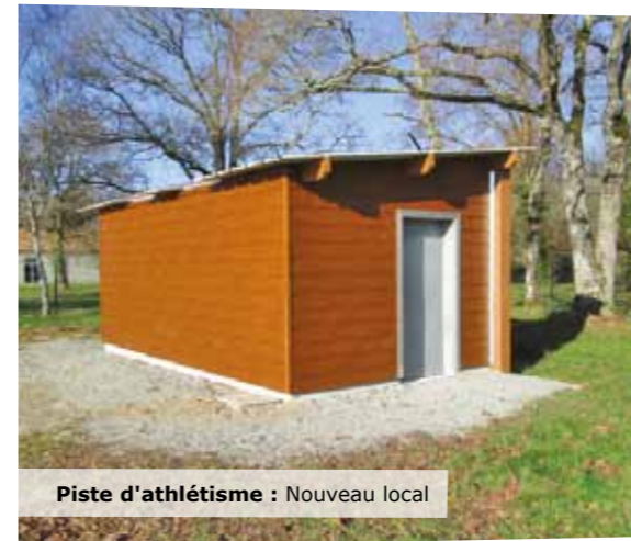
Piste d'athlétisme : Nouveau local