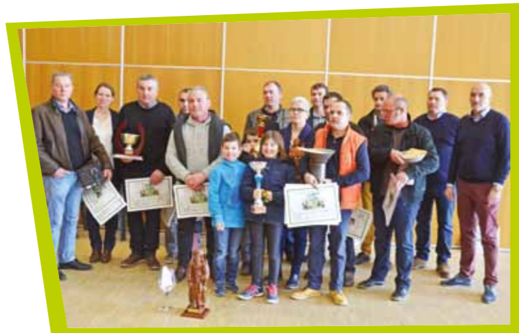
Concours communal des vins le 19 février.