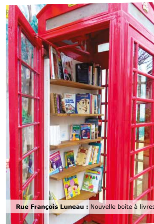
Rue François Luneau : Nouvelle boîte à livres