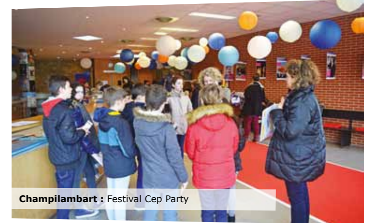
Champilambart : Festival Cep Party