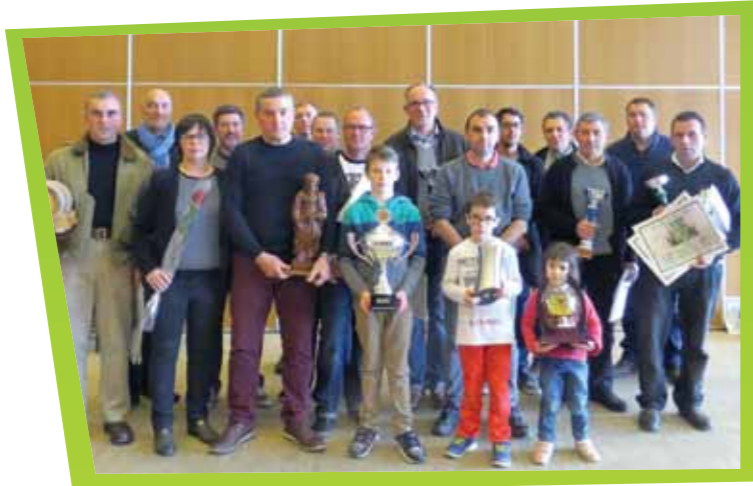
Lauréats du concours communal des vins 2016

1 est des rituels qui ne prennent pas une ride. Chaque année, et depuis maintenant 68 ans, Expo-Vall' s'inscrit comme le premier rendez-vous incontournable de début de printemps.