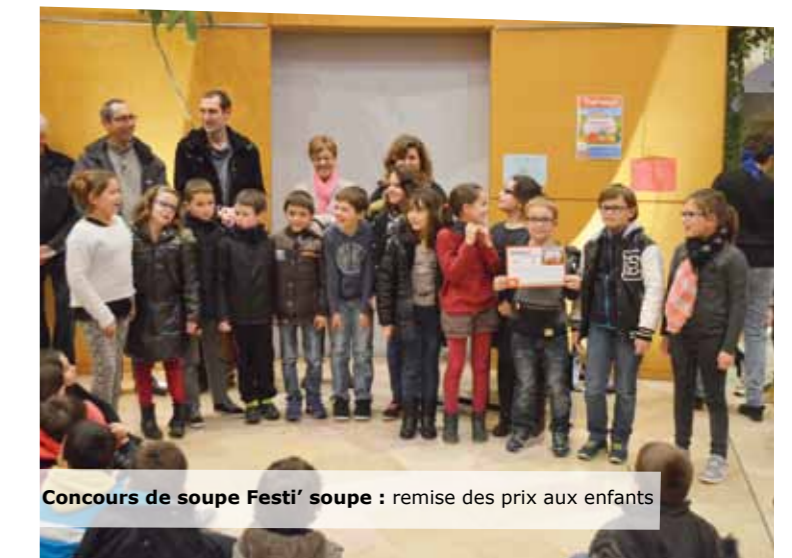
Concours de soupe Festi' soupe : remise des prix aux enfants