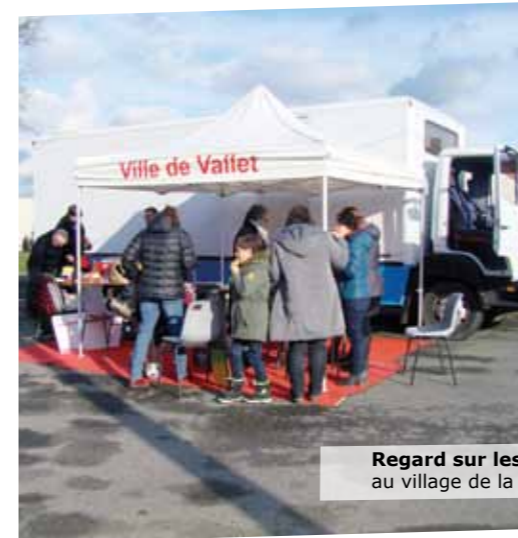
Regard sur les habitants : bus itinérant au village de la Chaloussière