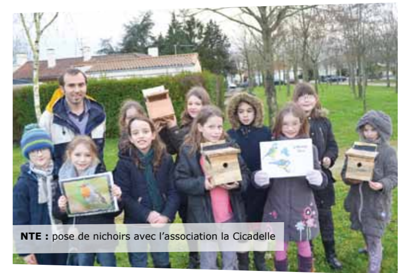
NTE : pose de nichoirs avec l'association la Cicadelle