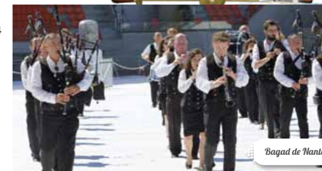
Bagad de Nantes