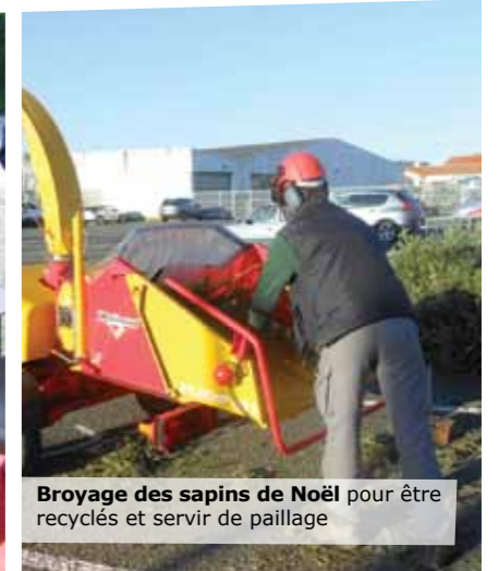
Broyage des sapins de Noël pour être recyclés et servir de paillage