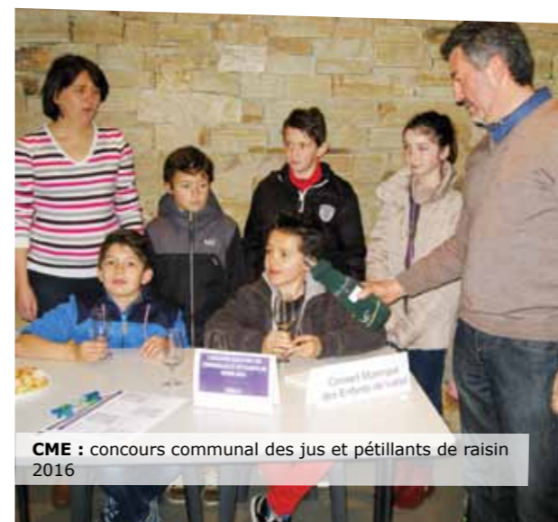
CME : concours communal des jus et pétillants de raisin 2016