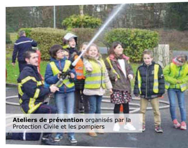
Ateliers de prévention organisés par la Protection Civile et les pompiers