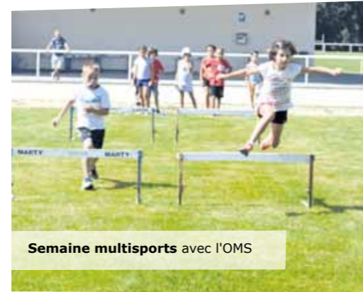
Semaine multisports avec l'OMS