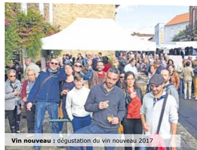
Vin nouveau : dégustation du vin nouveau 2017