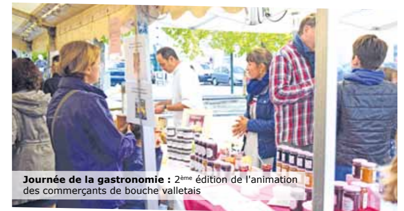
Journée de la gastronomie : 2 ème édition de l'animation des commerçants de bouche valletais