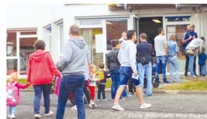
Ecole maternelle Paul Eluard

Depuis bientôt un mois, tous les élèves de Vallet ont repris le chemin de l'école. Pour assurer une rentrée sans fausses notes et un fonctionnement optimal du groupe scolaire Paul Eluard, une équipe d'agents municipaux s'active au quotidien, toute l'année. Si les élèves et l'équipe enseignante sont aux premières loges, une petite fourmilière forme « l'envers du décor ». Avec un objectif unique : le bien-être de l'enfant. Tour d'horizon.