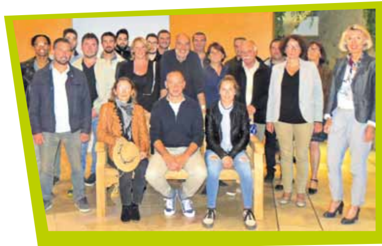
Réception donnée en l'honneur de sportifs valletais ayant participé à des championnats mondiaux (BMX et Lutte)

Comme chaque année, dès le printemps, la Ville mobilise tous les moyens dont elle dispose pour anticiper et mettre en œuvre une bonne reprise scolaire.