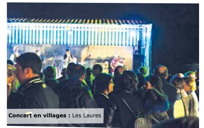
Concert en villages : Les Laures