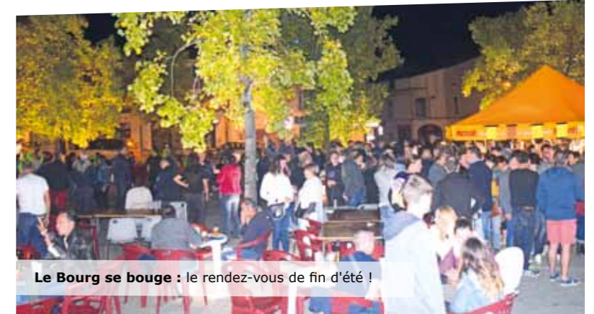
Le Bourg se bouge : le rendez-vous de fin d'été !