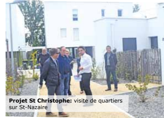
Projet St Christophe: visite de quartiers sur St-Nazaire