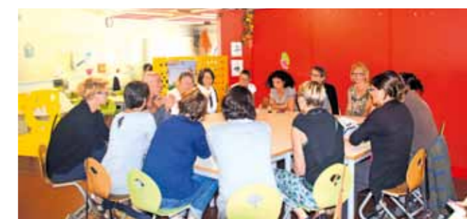
1 ère réunion de rentrée et de coordination entre tous les agents de la ville et les équipes enseignantes. Ateliers de travail autour de la communication et de la cohérence éducative pour maintenir un dialogue de qualité entre tous les personnels qui gravitent autour des élèves

Parmi les temps forts de cette rentrée, l'ouverture notamment d'une 8 ème classe en maternelle auprès des moyens et grandes sections : « La ville se réjouit que