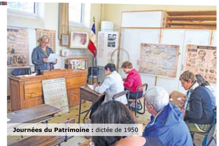
Journées du Patrimoine : dictée de 1950