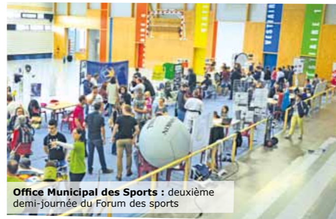
Office Municipal des Sports : deuxième demi-journée du Forum des sports