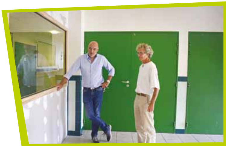
Visite travaux salle des professeurs école Paul Eluard