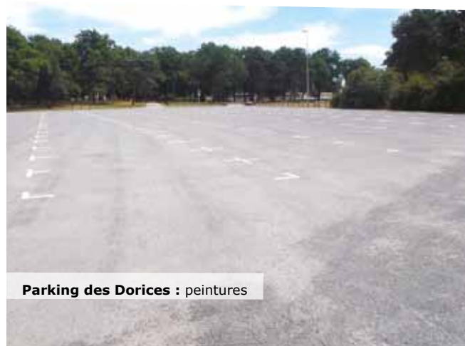
Parking des Dorices : peintures