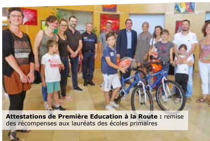
Attestations de Première Education à la Route : remise des récompenses aux lauréats des écoles primaires