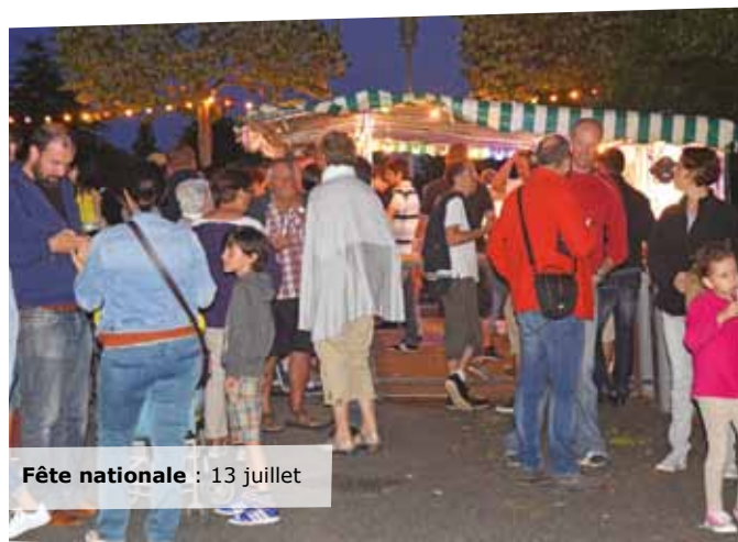
Fête nationale : 13 juillet