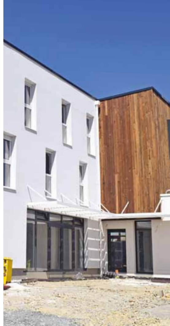
Foyer de jeunes travailleurs

Vallet est l'une des 7 villes pilotes de Loire Atlantique concernée par l'arrivée du très haut débit dès la rentrée 2017-2019. 7 000 usagers concernés.