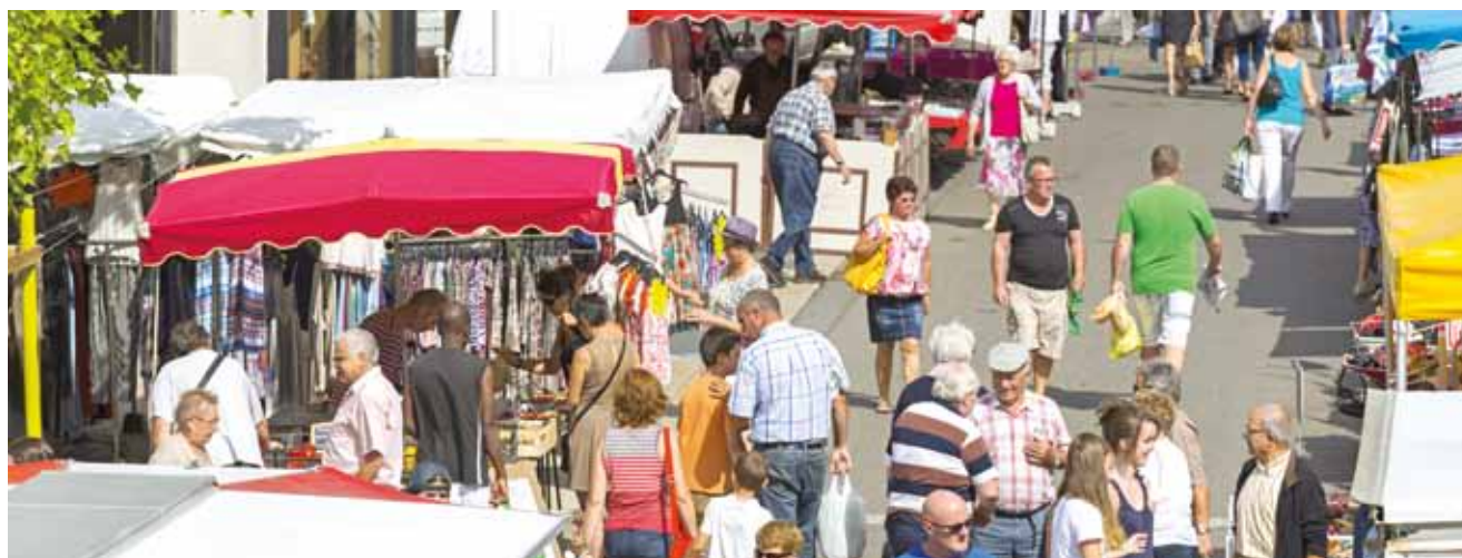
Marché de Vallet