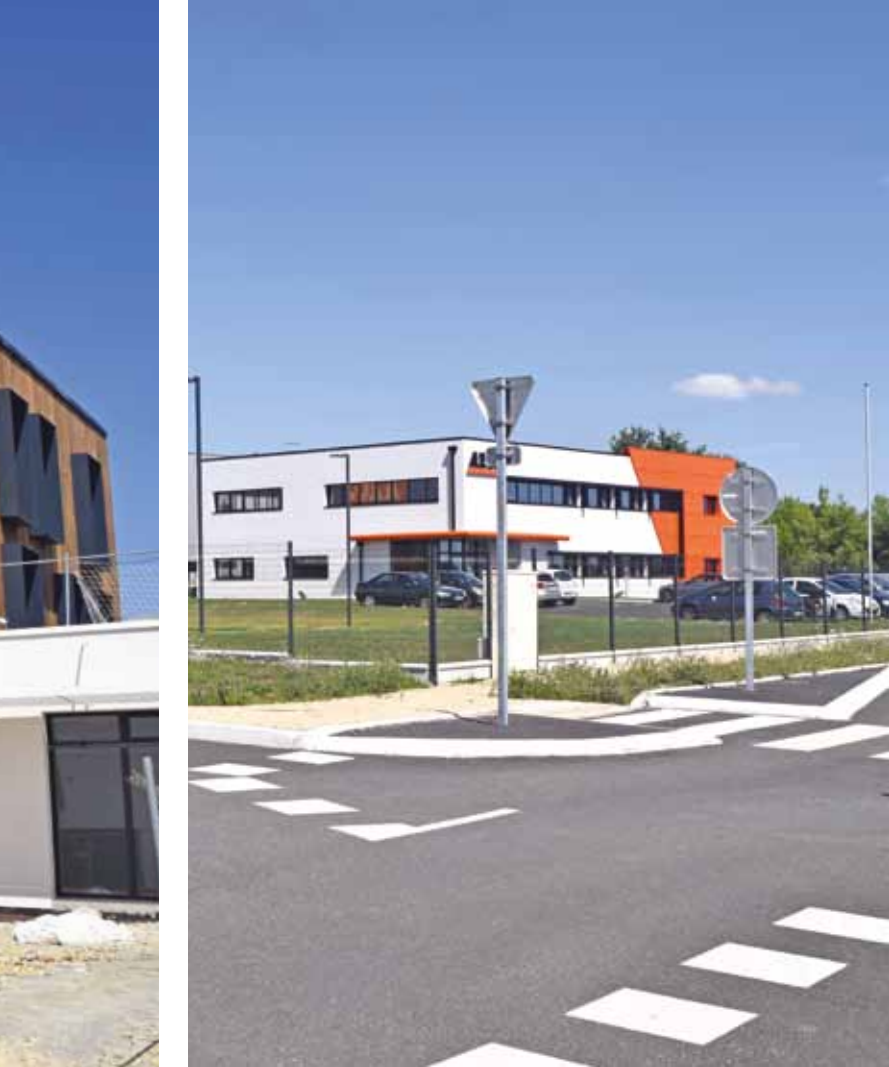
Zone des Dorices