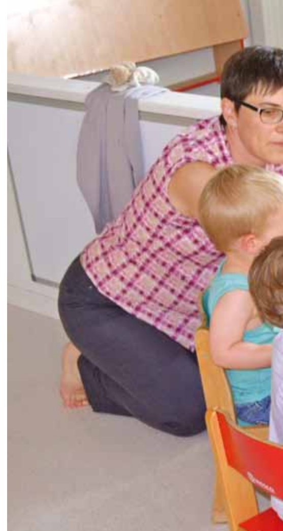
Crèche « La Maison des Doudous »