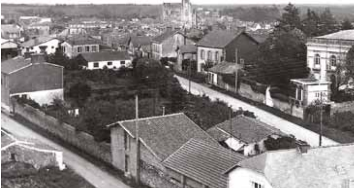
Route de Clisson

Elle relie le carrefour des « quatre routes » à la sortie du bourg, direction Mouzillon, dans le prolongement de la route d'Ancenis.