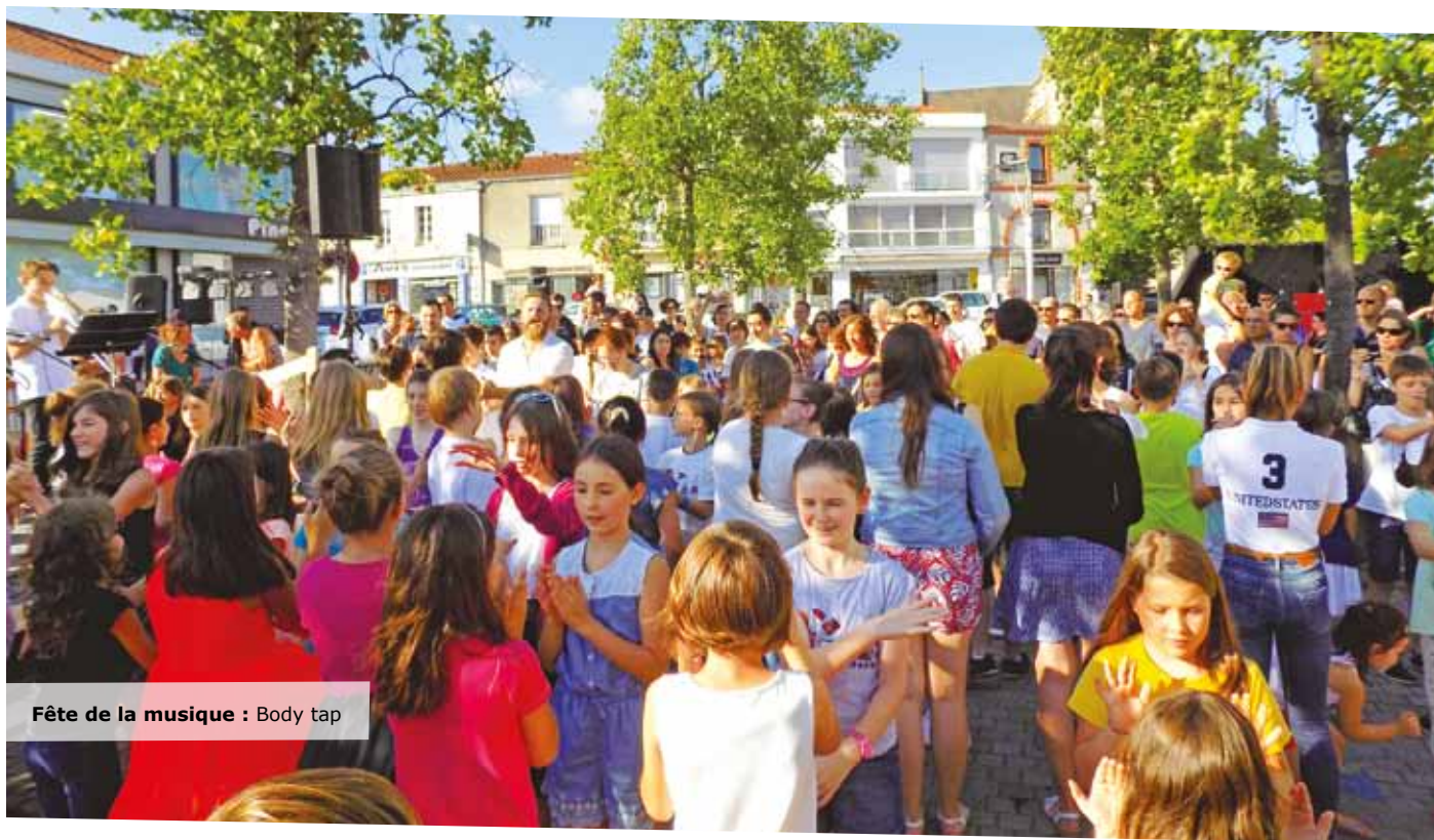
Fête de la musique : Body tap