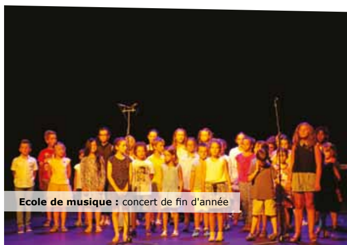
Ecole de musique : concert de fin d'année