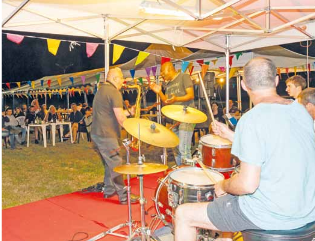
Concert en villages : Bonne Fontaine le 28 mai 2017

La vitalité d'une ville se mesure à sa capacité à mobiliser les énergies, à la rendre agréable pour tous. Une ville qui vit, c'est aussi une ville où ses habitants bénéficient d'une offre culturelle, sportive et d'animations de qualité et diversifiée.