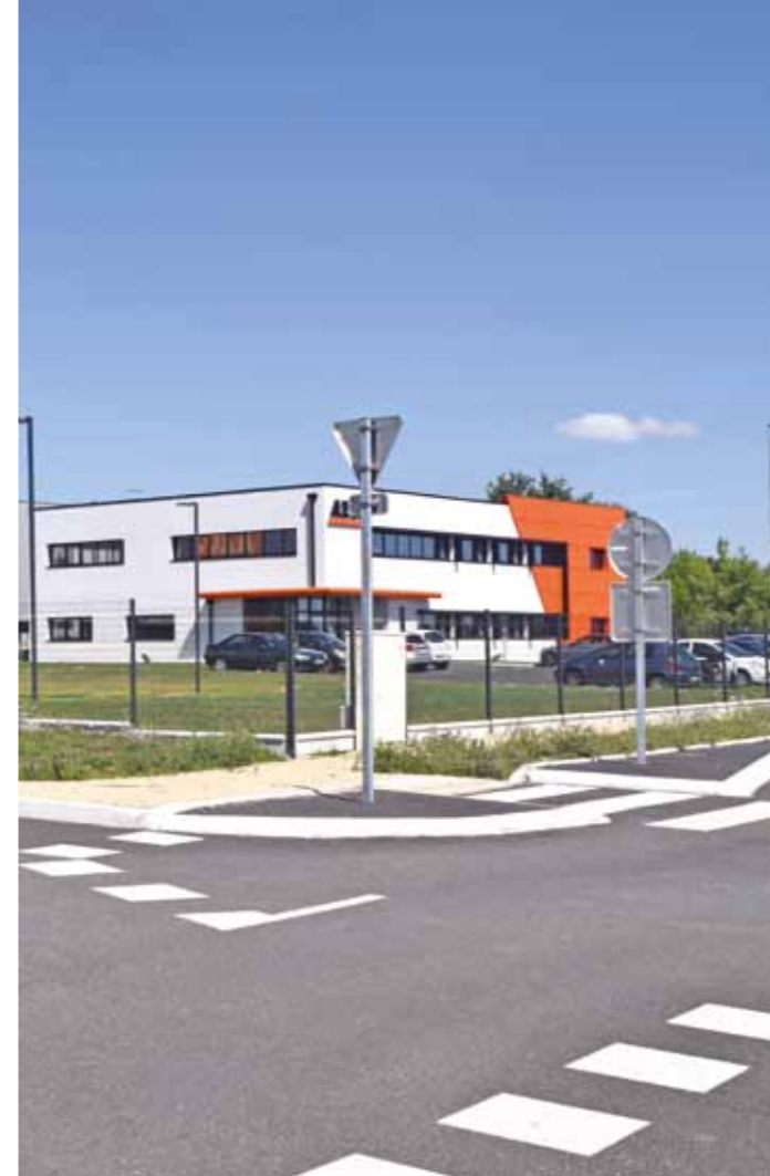
Zone Industrielle des Dorices