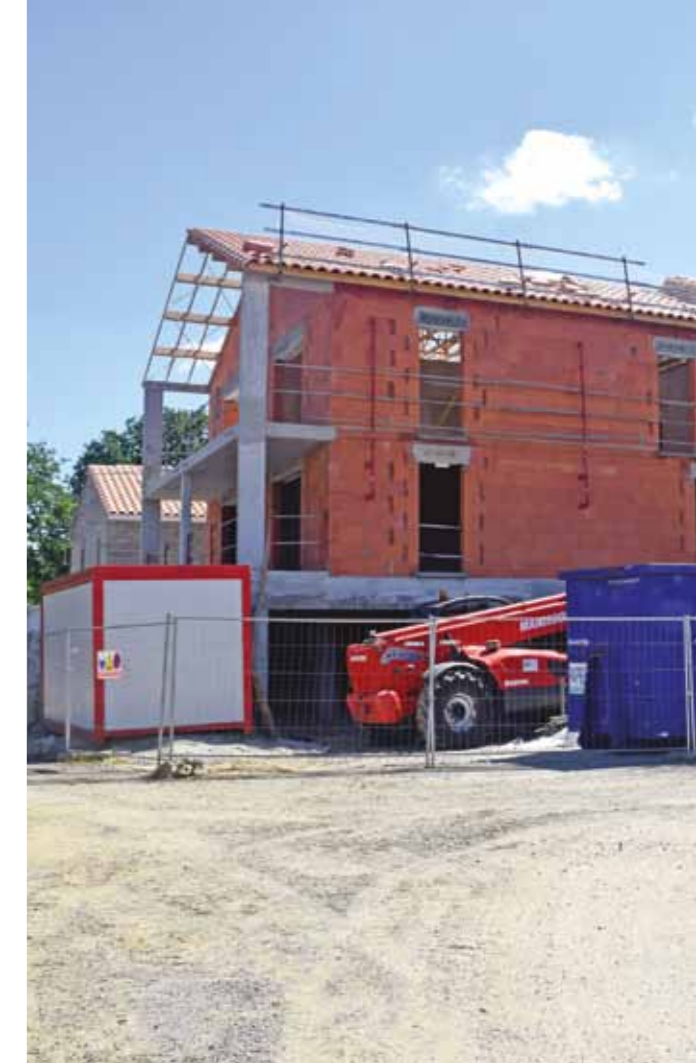
Lotissement Bois Brulé

Vallet est l'une des 7 villes pilotes de Loire Atlantique concernée par l'arrivée du très haut débit dès la rentrée 2017-2019. 7 000 usagers concernés.