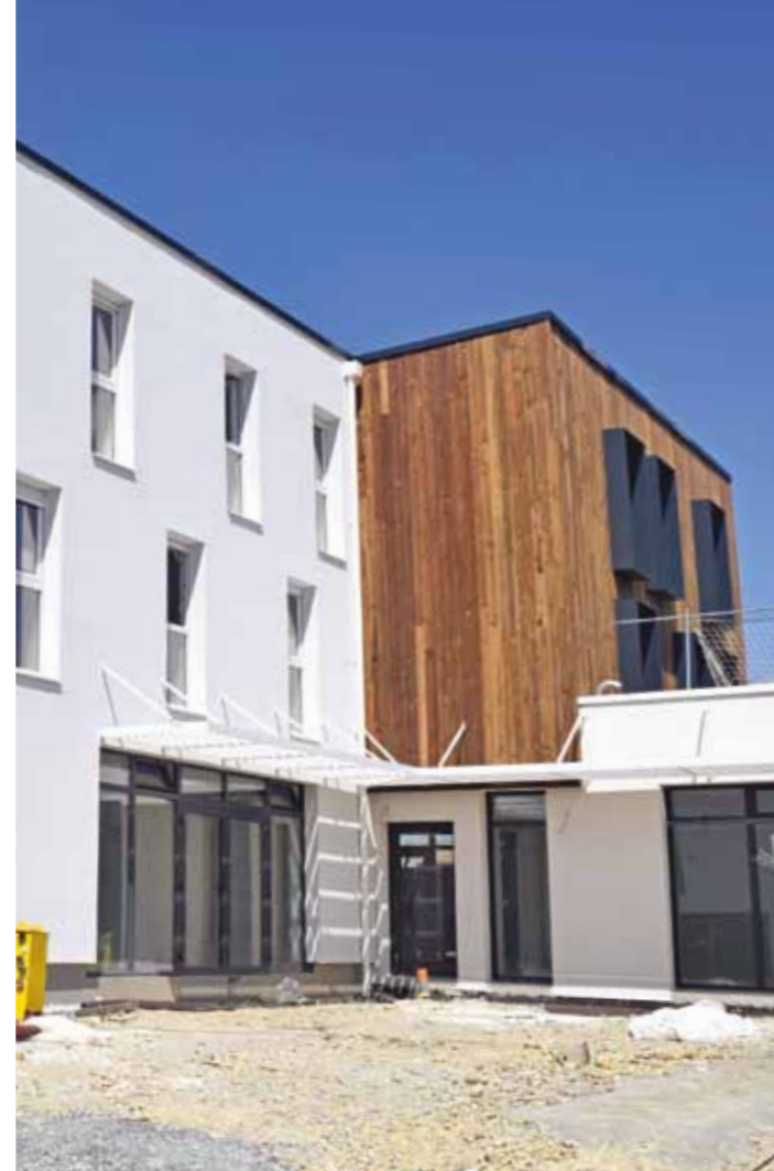
Foyer des jeunes actifs

ZI Dorices : 650 salariés / 60 entreprises / le plus gros parc d'activités du Vignoble Nb emplois sur Vallet : 2616