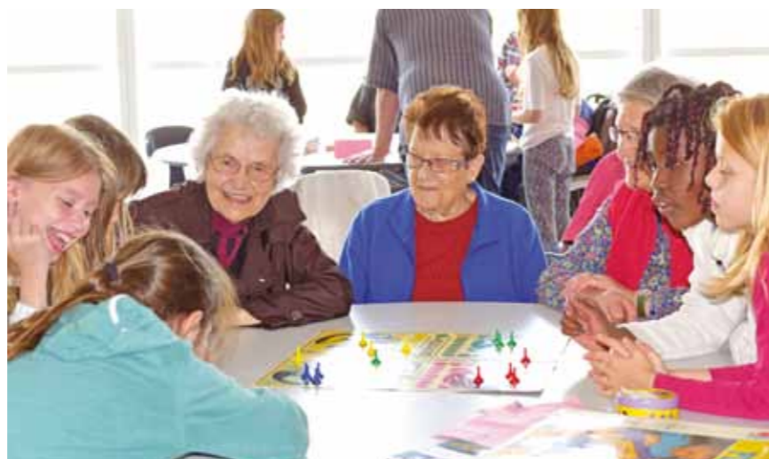
Atelier jeux de société intergénérationnels aux Pampres Dorés