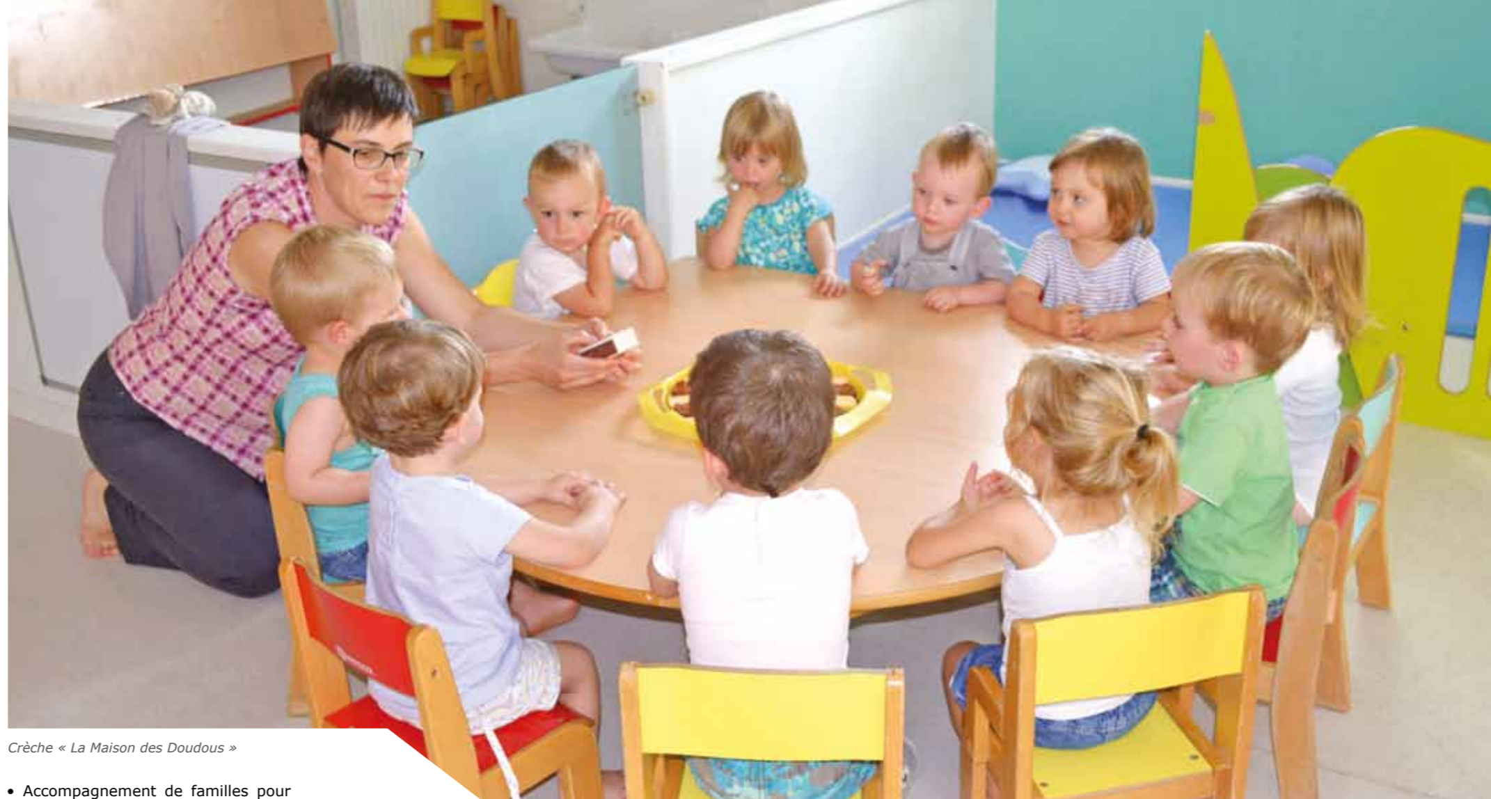
Crèche « La Maison des Doudous »