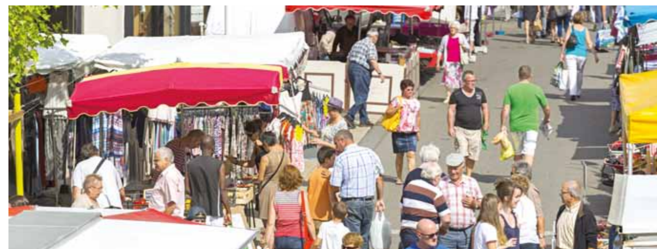
Marché de Vallet