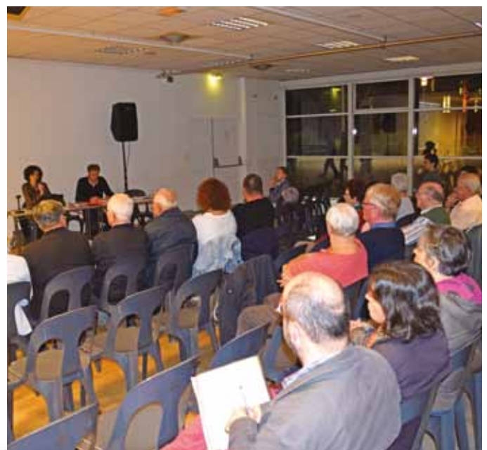
Réunion publique de présentation du projet lundi 16 octobre