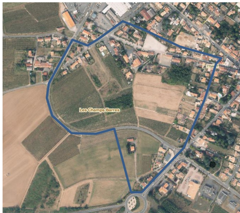
— PERIMETRE ETUDE CHAMPS BARRES

DE MANDATER Monsieur le Maire, ou son représentant, pour effectuer toutes les démarches et formalités nécessaires à ces études.